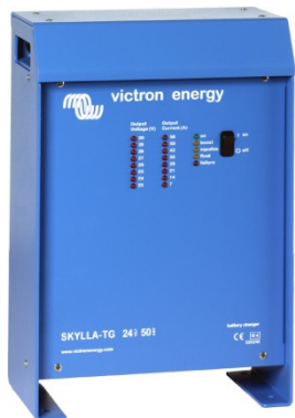
Chargeur Skylla 24 V 50 A